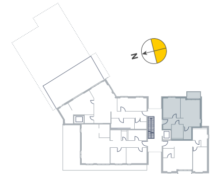
3. Obergeschoss (SG)